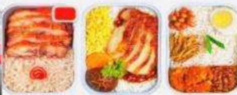
บริการอาหารร้อน ทั้งขาไป-ขากลับ