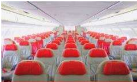
เครื่องลำใหญ่ 377 ที่นั่ง