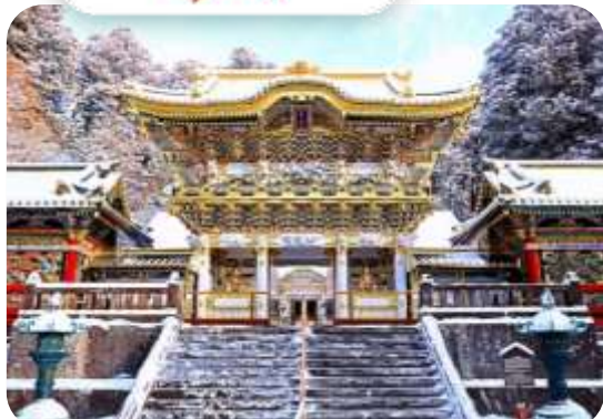
โปรแกรมเดินทาง 5 วัน 4 คืน AIR ASIA X

โตเกียว นาริตะ นิกโก้ ฟุจิ ลานสกีฟุจิเกิน