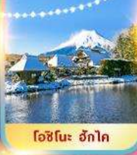
โอะชิโนะ ะกัตสึ