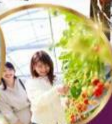
บุฟเฟต์ สดอเบอร์รี่ เก็บสดจากต้น