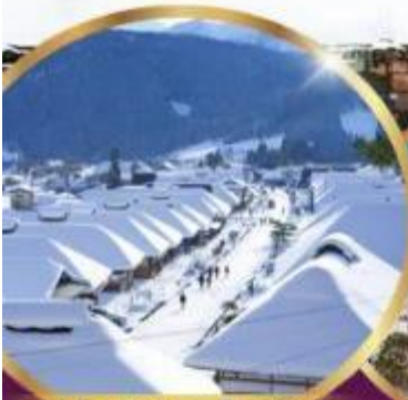
หมู่บ้านโบราณ โออุจิ จุกุ