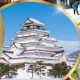
ปราสาท สึรุกะ