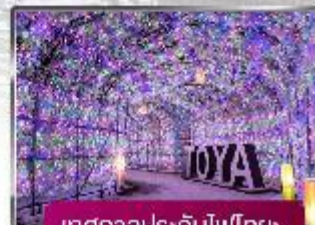
เทศกาลประดับไฟไทย