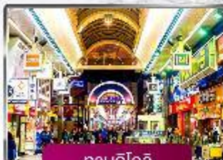
ทานุกิโดจิ