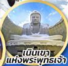
เป็นเขา แห่งพระพุทธรเจ้า

ชมความน่ารักของสัตว์ต่างๆ ที่พิพิธภัณฑ์สัตว์น้ำโอตารุ