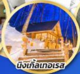
นิงเกิ้ลเทอเรส