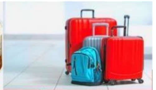
น้ำหนักกระเป๋า สูงสุด 20 กก.