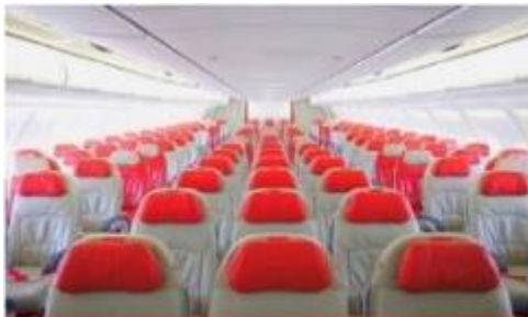
เครื่องบินลำใหญ่ 377 ที่นั่ง

ตัวเครื่องบินเป็นตู้กรู๊ปสำหรับคณะทัวร์ ระบบของสายการบินจะทำการแรนดอมที่นั่ง ซึ่งไม่สามารถล็อกหรือเลือกที่นั่งได้ หากลูกค้าต้องการเลือกที่นั่ง ทางสายการบินมีบริการอัพเกรดที่นั่ง (ค่าบริการเป็นไปตามที่สายการบินกำหนด)