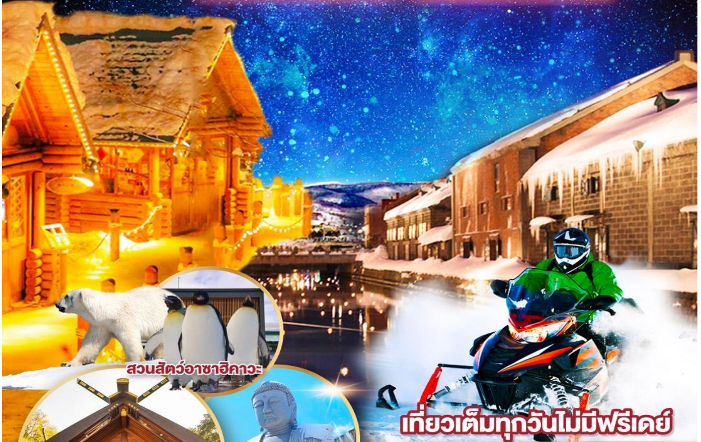
สวนสัตว์อาซาฮิคาวะ

พักโรงแรมในชิปปโปโร 2 คืน เต็มอิ่มกับกิจกรรมลานสกี