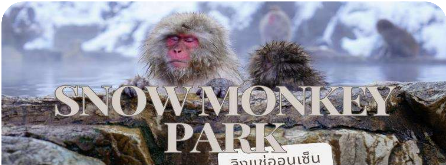
ลิงแช่ออนเซน

นำท่านเดินทางสู่ สวนลิงจิโกคุดาบิ (Jigokudani Monkey Park) หรือสวนลิงออนเซน (Snow Monkey Park) เป็นส่วนหนึ่งของอุทยานแห่งชาติโจชินเอ็ตสึ โคเจ็น (Joshinetsu Kogen) ตั้งอยู่ในหุบเขาจิโกคุดาบิ (Jigokudani) ที่มีความหมายว่า “หุบเขานรก” เนื่องจากบริเวณของหุบเขายังคงมีไอน้ำและน้ำพุร้อนที่ออกมาจากรอยแยกเล็กของพื้นดิน เป็นแหล่งท่องเที่ยวอีกแห่งหนึ่งที่ได้รับความนิยมจากนักท่องเที่ยวที่มาเยือนเมืองนาగాโนะ (Nagano) นำท่านเดินเท้าเข้าไปยังบ่อออนเซนที่มีฝูงลิงญี่ปุ่นแก้มแดงกำลังแช่ออนเซนคลายหนาวกันอย่างสบายใจ อิสระให้ท่านเก็บภาพความน่ารักของฝูงลิงแก้มแดง และบรรยากาศความสวยงามรอบๆ บ่อออนเซนแห่งนี้