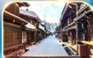
เมืองเก่าชินมาชิซูจิ