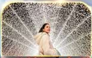
ชมงานประดับไฟนาฮานา ในะ ซาโตะ