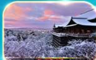
วัดคิโยมิตสึ