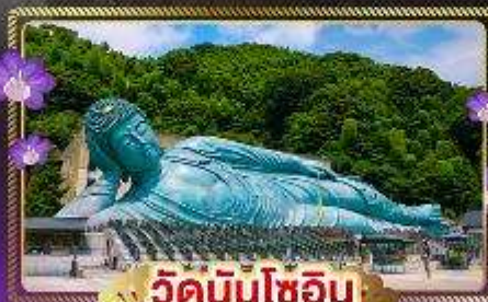
วัดนินโซอิน