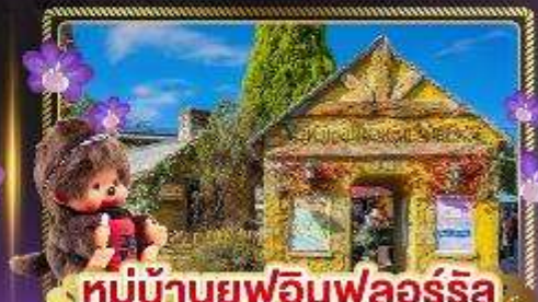
หมู่บ้านยูฟูอินฟลอร์ริล