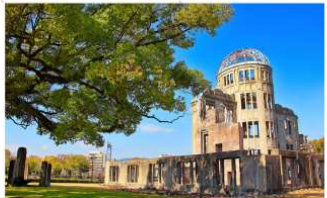
รับประทานอาหารกลางวัน ณ กัดตาคาร