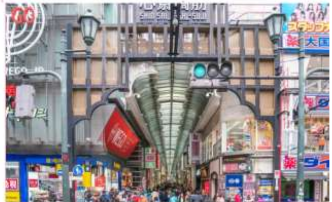
อิสระอาหารกลางวันตามอัธยาศัย (ไม่รวมในรายการ)