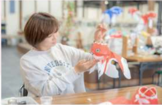
GOLDFISH LANTERN MAKING