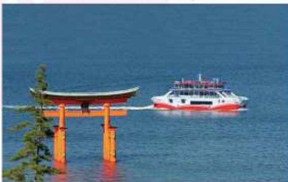
TAKE FERRY & VISIT ITSUKUSHIMA SHRINE

"ศาลเจ้าอิซุกุชิม่า" เป็นหนึ่งในแลนด์มาร์คที่สำคัญของญี่ปุ่น ตั้งอยู่บนเกาะมิยาจิม่า จังหวัดอิริชิม่า โดยมีเอกลักษณ์ที่โดดเด่นคือ ประตูกิโตรีอิขนาดใหญ่ที่ตั้งอยู่กลางทะเล ทำให้ศาลเจ้าแห่งนี้ดูลึกลับและสวยงามเป็นอย่างยิ่ง และได้รับการขึ้นทะเบียนเป็นมรดกโลกโดยองค์การยูเนสโกด้วย