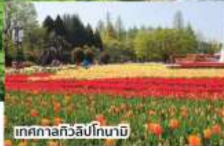
เทศกาลทิวลิปโทนาบี