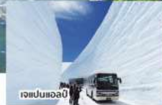
เจแปนแอลป์