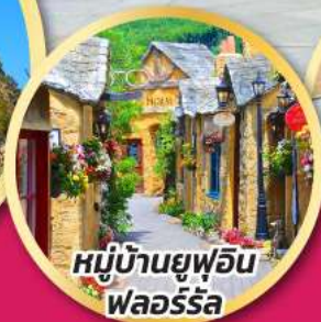
หมู่บ้านยูฟูอิน ฟลอร์ริล