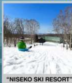
"NISEKO SKI RESORT"