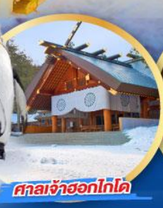
ศาลเจ้าฮอกไกโด