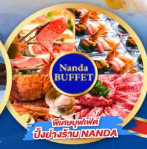
พิกะบุฟเฟ่ต์ บึงย่างร้าน NANDA

เดินทาง (วันปีใหม่ 2568) 27 ธ.ค.-01 ม.ค. 68 29 ธ.ค.-03 ม.ค. 68