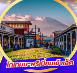
โทเทมบะ-พรีเมียมเฮ้าส์