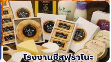
โรงงานชีสฟูรานะ