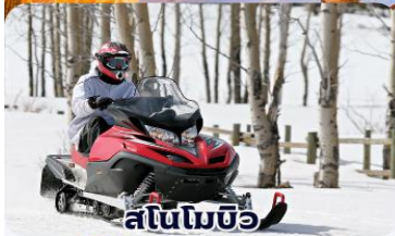
สโนว์แมชีน