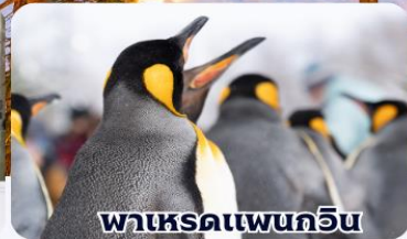
พาเหรดเพนกวิน