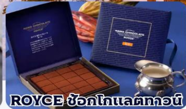
ROYCE ช็อกโกแลตทอว์น