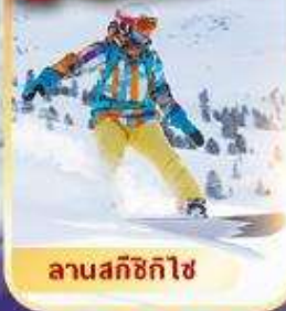
ลานสกีซิกิไซ