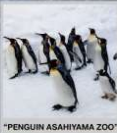
"PENGUIN ASAHIYAMA ZOO"