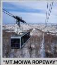
"MT. MOIWA ROPEWAY"