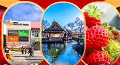
มิดซูเอจ่ากเสด

Strawberry Piking ลานสกี มีนากามิ ออนเซน ยูนาตากะ สวนสาธารณะโอมิโอะซิดาชิ ถนนช้อปปิ้งคารุอิซาวะกินซ่า หมู่บ้านน้ำใส โอชิโนะอากิโก ซงซาแบบญี่ปุ่น หรือ พิพิธภัณฑ์ แผ่นดินไหว จุดพักรถกลางทะเล โตเกียวเบย์ แคนนอน มิดซูเอจ่ากเสด อีออนมอลล์