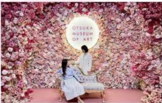
OTSUKA MUSEUM OF ART