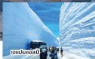
เจแปนไอศกรีม