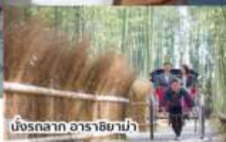
นังรอลาก อาราชิมามา