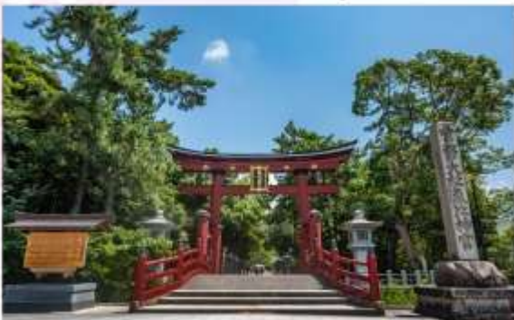
KEHI JINGU SHRINE

“ศาลเจ้าเคอิ จิงกุ” เป็นหนึ่งในศาลเจ้าเก่าแก่ และสำคัญที่สุดแห่งหนึ่งในญี่ปุ่น มีอายุกว่า 1,300 ปี จุดเด่นที่โดดเด่นที่สุด คือโทริอิไม้ขนาดใหญ่สูงประมาณ 11 เมตร ซึ่งเป็นหนึ่งในสามของโทริอิไม้ที่ใหญ่ที่สุดในญี่ปุ่น และได้รับการขึ้นทะเบียนเป็นสมบัติทางวัฒนธรรมที่สำคัญ ผู้คนมักจะมาขอพรในเรื่องต่าง ๆ เช่น สุขภาพ ความรัก การงาน และความสำเร็จ