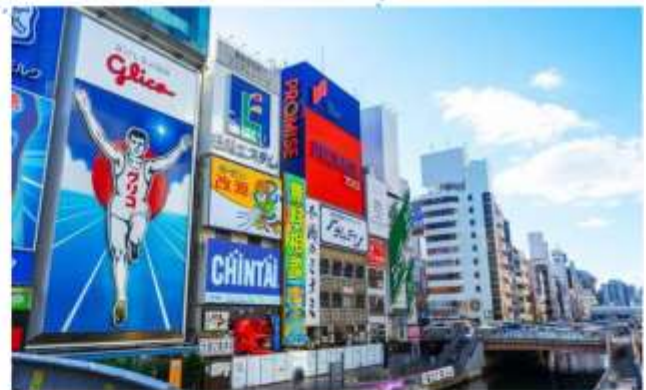
SHOPPING AT SHINSAIBASHI

“โรงงานชิกิกะโช” ชมมินิจู รสนม ของฝากสุดคลาสสิกจากโอซาก้า มีขนมหวานมากกว่า 100 ชนิด รวมถึงขนมและเค้กญี่ปุ่น ท่านสามารถเพลิดเพลินกับการช้อปปิ้งขนมหวานได้ตามใจชอบ