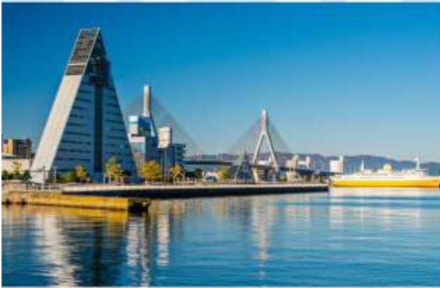
TRNF TO AOMORI