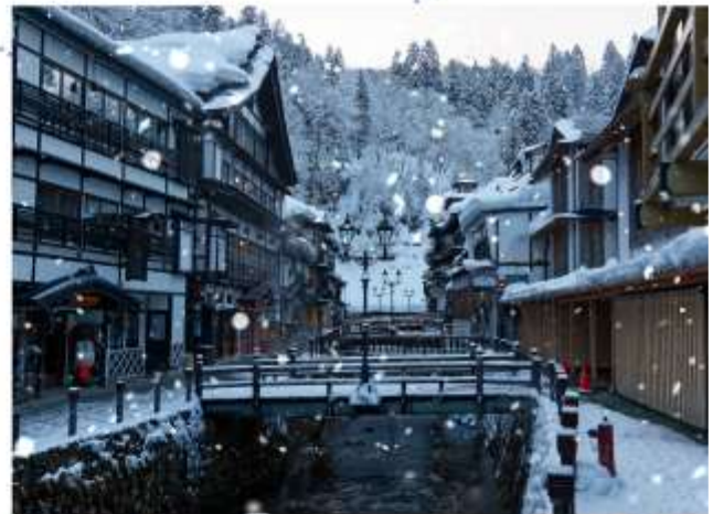
VISIT GINZAN ONSEN