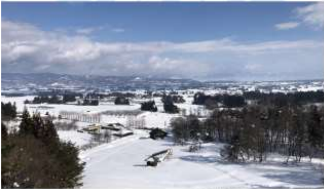
VISIT IDE DONDEN DAIRA SNOW