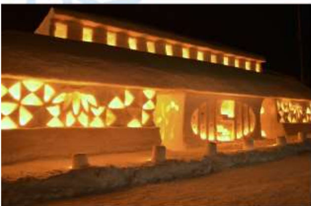
VISIT YUKI HATAGO FESTIVAL

พิเศษ!!! สุดตระการตา กับ “Yuki Hatago Festival” หรือ “เทศกาลกระท่อมหิมะส่องแสง” เป็นงานเทศกาลฤดูหนาวที่จัดขึ้นที่เมืองยามาغاتะ โดยจะจัดขึ้นในช่วงปลายเดือนกุมภาพันธ์ถึงต้นเดือนมีนาคมของทุกปี เทศกาลนี้จะพาทุกท่านไปสัมผัสกับความงดงามของหิมะและแสงไฟในบรรยากาศที่โรแมนติก อีกทั้งยังได้เข้าไปในกระท่อมหิมะ หรือดื่มเครื่องดื่มใน Ice Bar เป็นประสบการณ์ที่หาได้ยากมาก