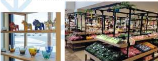
SHOP AT GOOD YAMAGATA & MICHINOEKI ZAO

อิสระช้อปปิ้ง “มิชิโนะเอกิ ซาโอะ” ตลาดเกษตรกรของแท้ที่จำหน่ายผลิตภัณฑ์ในท้องถิ่นหลากหลายประเภท เป็นสถานที่พิกัดรวมทางที่มีชื่อเสียงและเป็นประตูสู่ภูเขาซาโอะ หนึ่งในแลนด์มาร์คสำคัญของจังหวัดยามาغاتะ