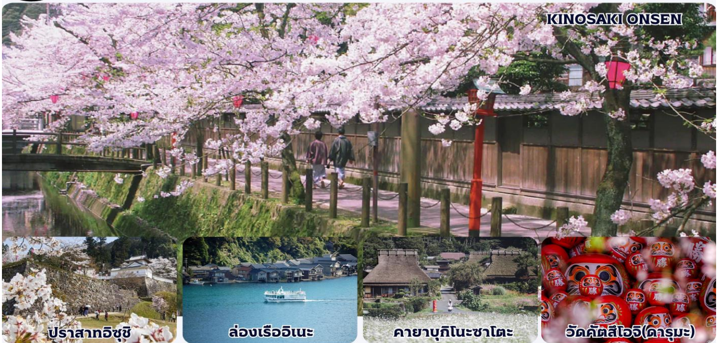
ปราสาทอิซุชิ

📍 เที่ยงโกะ(อิซุชิ,คิโนะซากิ)-เกียวโต(อินะ,มียะจิ)-โอซาก้า