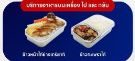
บริการอาหารบนเครื่อง ไป และ กลับ