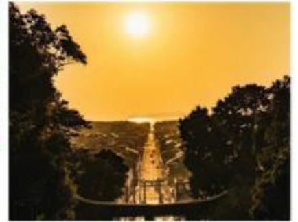
ศาลเจ้ามิยาจิดาเกะ Miyajidake Shrine

จากนั้นนำท่านเดินทางกลับสู่ เมืองฟูกุโอกะ เมืองใหญ่อันดับ 6 ของญี่ปุ่น และเป็นเมืองที่ได้รับการจัดอันดับว่าเป็นเมืองน่าอยู่อันดับที่ 12 ของโลก