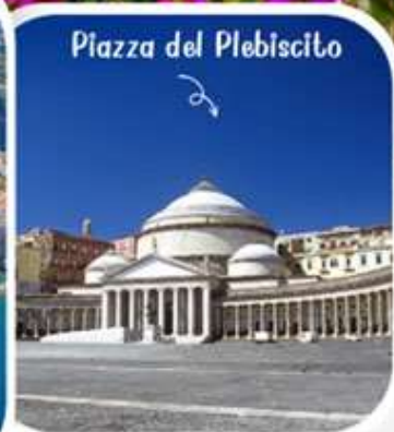
Plaza del Plebiscito