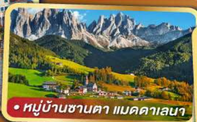
• หมู่บ้านซานตา แมดดาเลนา