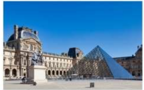
พิพิธภัณฑ์ลูฟร์

หลังจากนั้นนำท่านเดินทางสู่ La Vallee Village Outlet