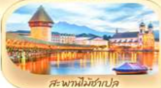
สะพานไมซ์าเปล