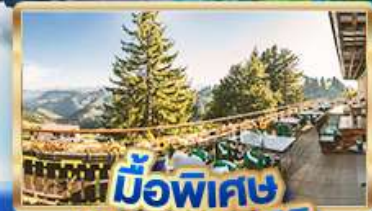
มือพิเศษ บียอดเวริท