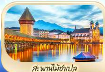
สะพานไมซ์ฮาเปล