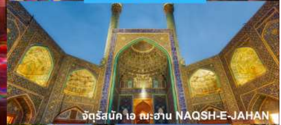
จัตุรัสบิก ไอ ฉะฮาน NAQSH-E-JAHAN