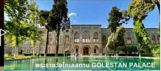
พระราชวังโกเลสถาน GOLESTAN PALACE