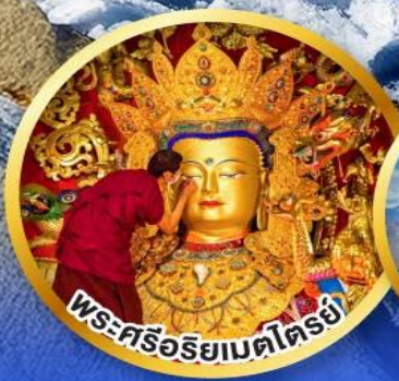
พระศรีอริยเมตไตรย์