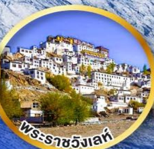
พระราชวังเลห์