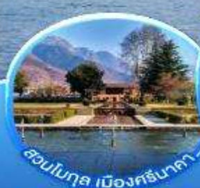
สวนโมกุล เมืองศรีนาคา