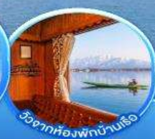
วิวจากห้องพักบ้านเรือ