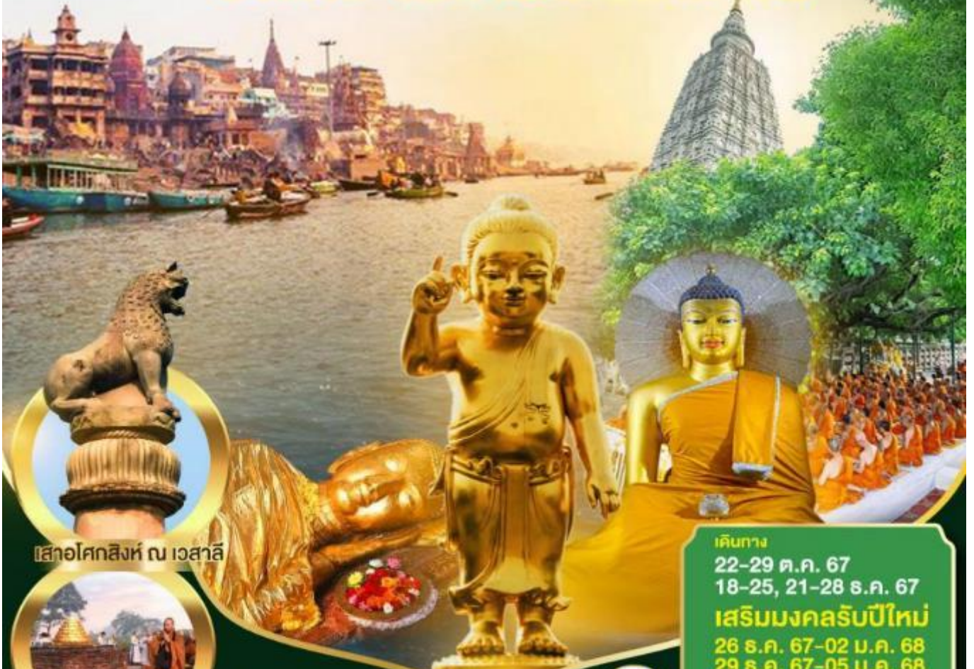
เสาชิงช้า กรุงเทพฯ