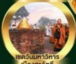
เขาคันทรมาฬาร เมืองสาวัตถี