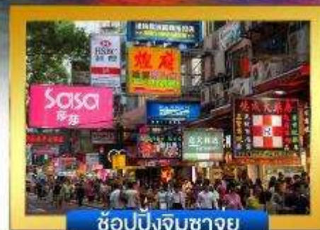
ช้อปปิ้งจิมซาจู้