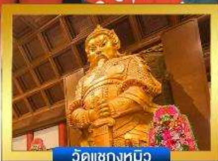
วัดเขangkหมิว

📍 อิสระช้อปปิ้งย่านจิมซาจู้ & คอสเวย์เบย์