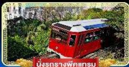
นั่งรถรางพิกเกอร์ม

นั่งกระเช้ามองปิง 360 องศา บินลัดฟ้าไปมู..สู่เกาะฮ่องกง