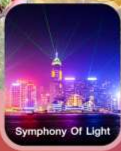
Symphony Of Light

✈️ คอนเฟิร์มออกเดินทาง ทุกพีเรียด 2 ท่านขึ้นไป ✈️