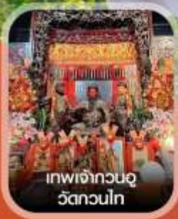
เทพเจ้ากวนอู วัดกวนไท