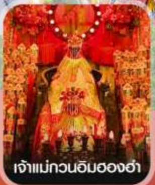
เจ้าแม่กวนอิมของฮำ