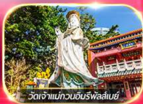
วัดเจ้าแม่กวนอิมพรอสเปอ