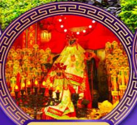
วัดเจ้าแม่กวนอิม ฮ่องง่า