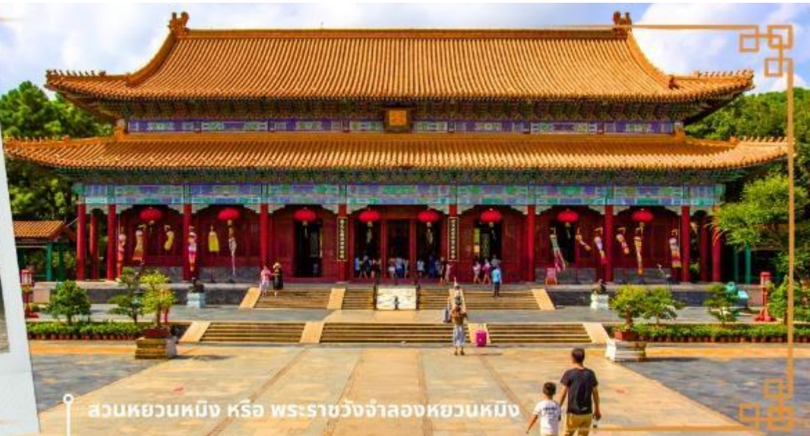
สวนหยวนหมิง หรือ พระราชวังจำลองหยวนหมิง