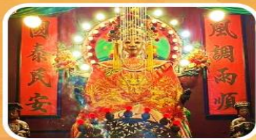
วัดเจ้าแม่กวนอิมเทียนหัว