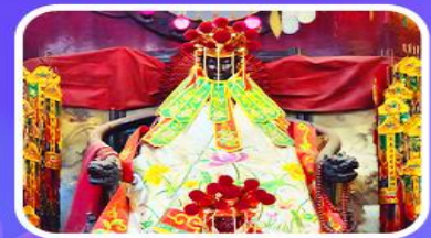
วัดเจ้าแม่กวนอิมสองอ่า