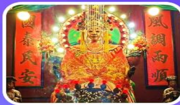
วัดเจ้าแม่กวนอิมเทียนหัว