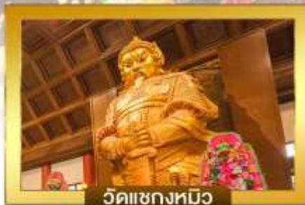
วัดแซงหมิว