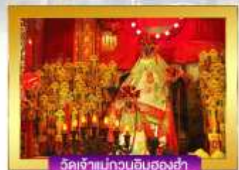
วัดเจ้าแม่กวนอิมฮองฮ่า