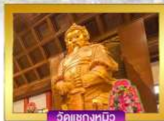
วัดเซกกงหมิว