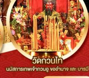
วัดกวนไท่

นมัสการองค์เจ้าแม่กวนอิม อายุกว่า 600 ปี