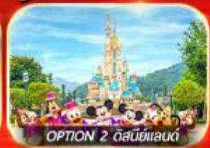
OPTION 2 ดิสนีย์แลนด์

เต็มอิ่ม ทั้งไหว้พระ-ขอพร การเงิน การงานความรักและซ่อมปัง