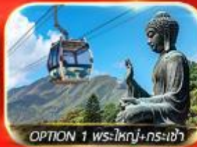
OPTION 1 พระใหญ่+กรงเจ้า