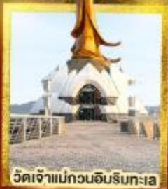
วัดเจ้าแม่กวนอิมริบทะเล