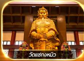
วัดเขangkหมิว